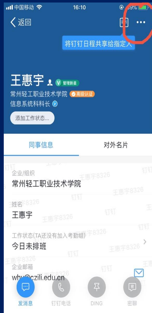
2、选择顶部菜单，我的信息