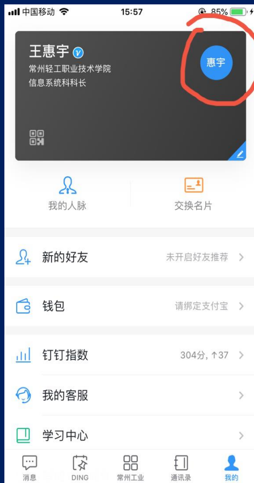
1、点底部“我的”，再点上面头像