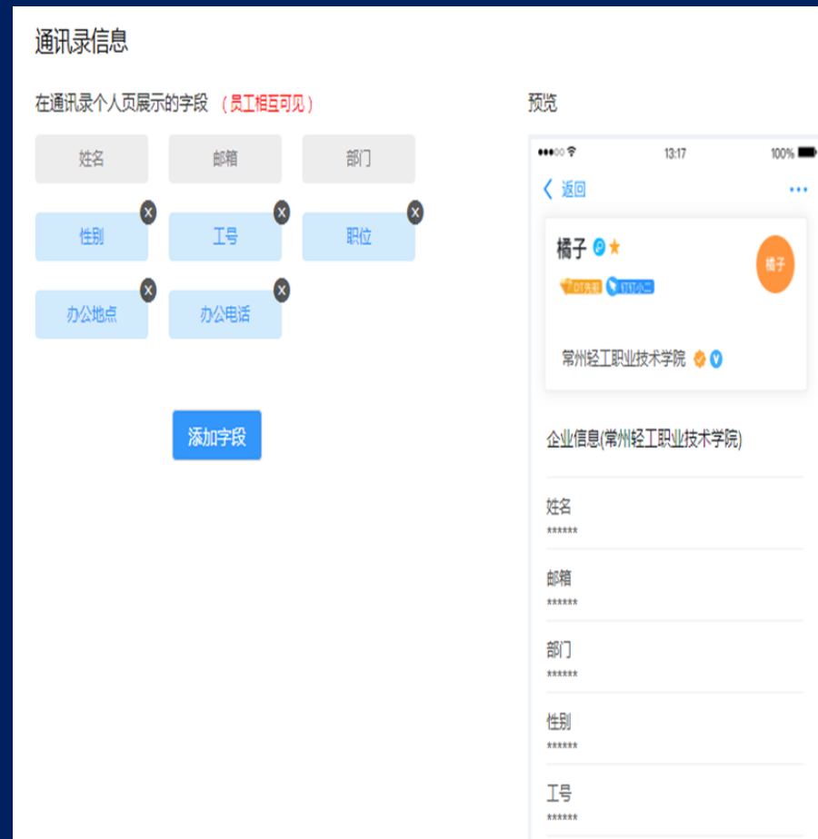
设置的个人信息可对同事展示